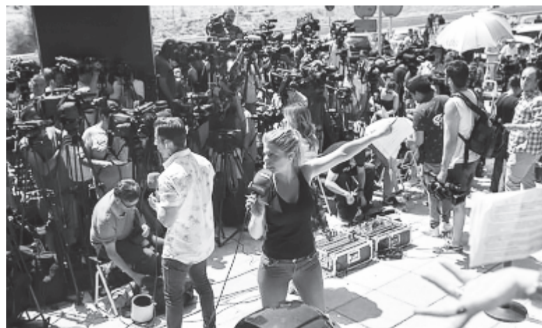
A bíróság épülete előtt a világ minden tájáról érkezett több mint 200 újságíró és mintegy 40 operátor várt a labdarúgóra, aki azonban egy hátsó bejáraton közvetlenül a garázsba hajtott autójával

A spanyol ügyészség júniusban azzal gyanúsította meg Ronaldót, hogy 2011 és 2014 között 14,76 millió euró adót nem fizetett be az államkasszába, ügyvédei ugyanakkor nyilvánosan visszautasították ezt. Ha a portugál válogatott csapatkapitányát mégis bűnösnek találja a bíróság, legalább 15 hónapos börtönbüntetés vár rá, amelyet azonban büntetlen előlétele miatt valószínűleg nem kell letöltenie.