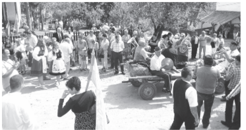
Nagy számban sereglettek össze az ünnepségre a kis faluban

Amíg az ebéd elkészült, színpadi műsorok szórakoztatták a minden várakozást felülmúló számban összegyűlt