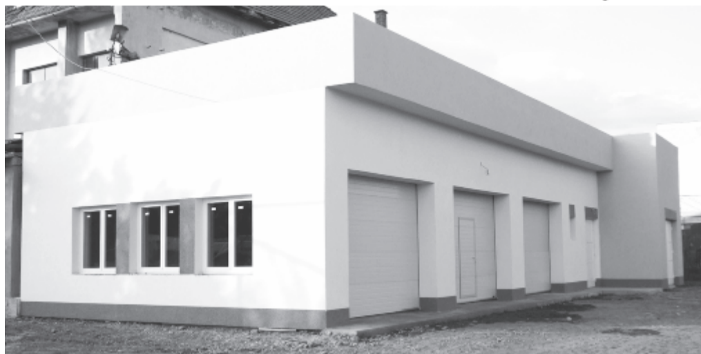
Ősszel új, jól felszerelt műhelyben kezdhetik az autószerelő szakoktatást